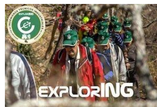
ExplorING, actividad de la Asociación de Ing. Téc. Industriales de Cáceres