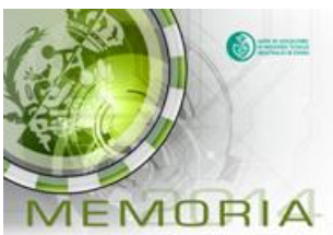
MEMORIA UAITIE 2014